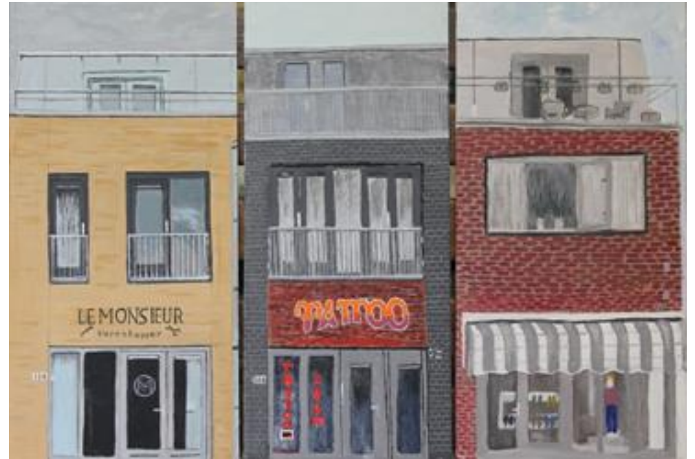
Best goed gelukt!