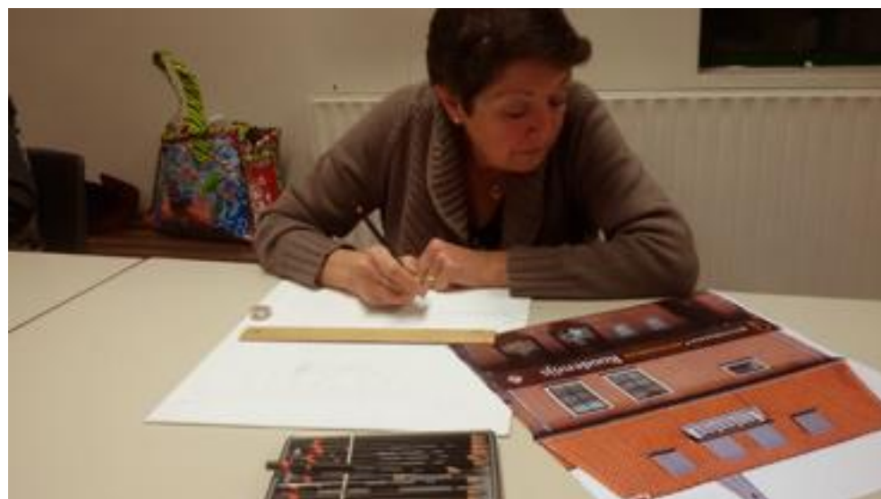
Een heel nauwkeurige schets