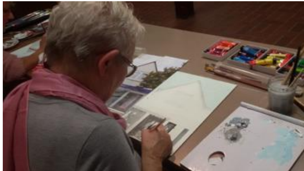
Allen grijs en wit of ook nog kleur?