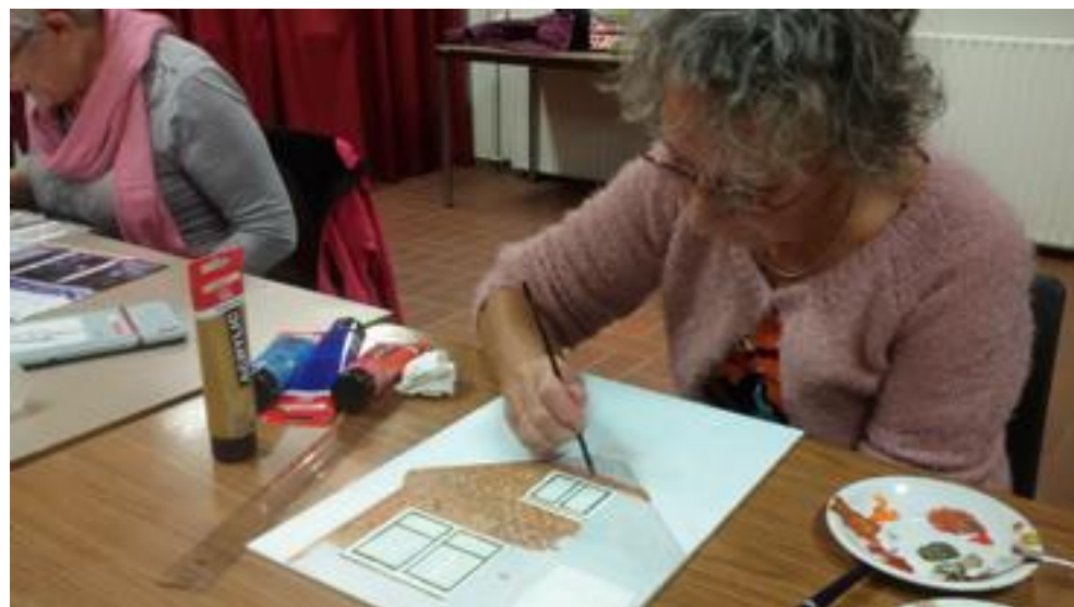
Historische pandje wordt opgezet met de eerste laag verf