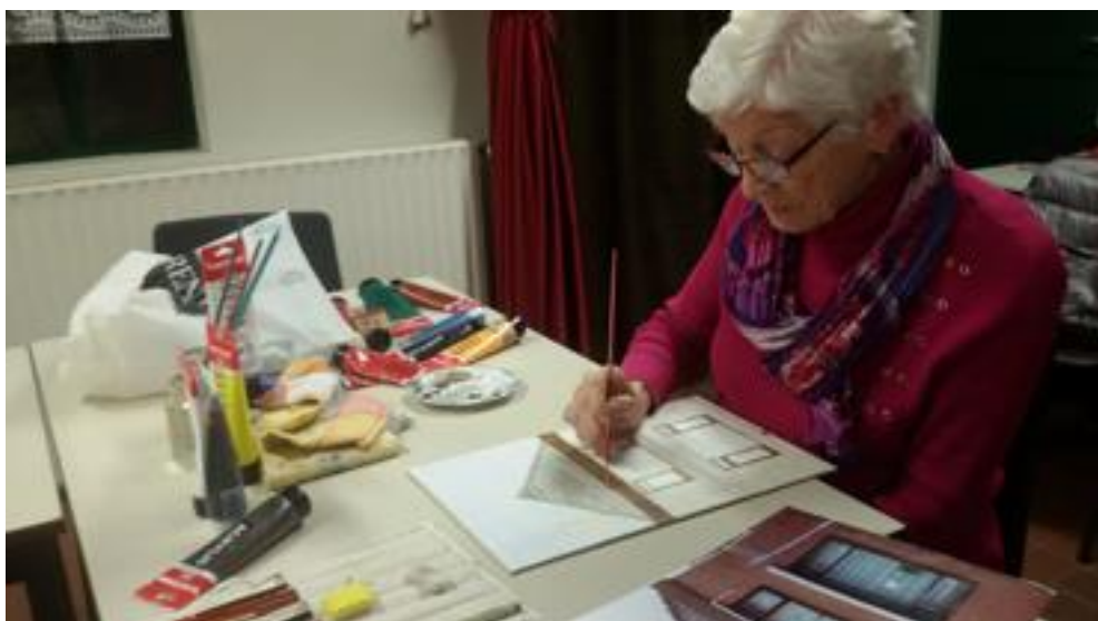
De eerste laag verf wordt aangebracht