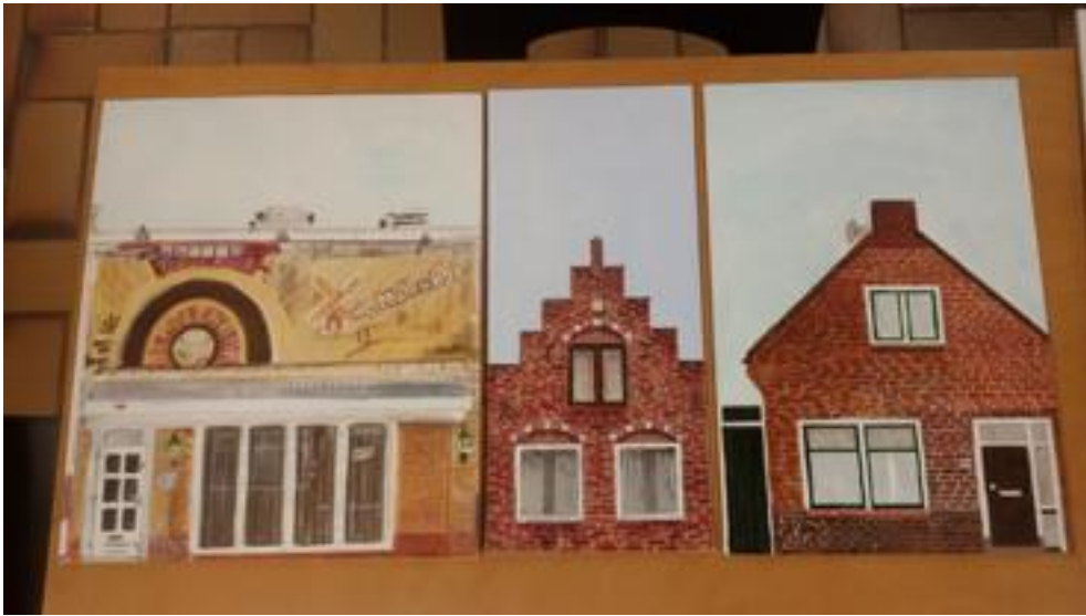
Ja, deze zijn wel klaar