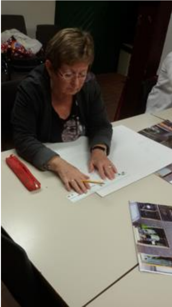
Ook hier weer een nauwkeurig opzet