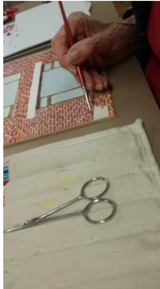
Die steentjes zijn toch wel erg moeilijk