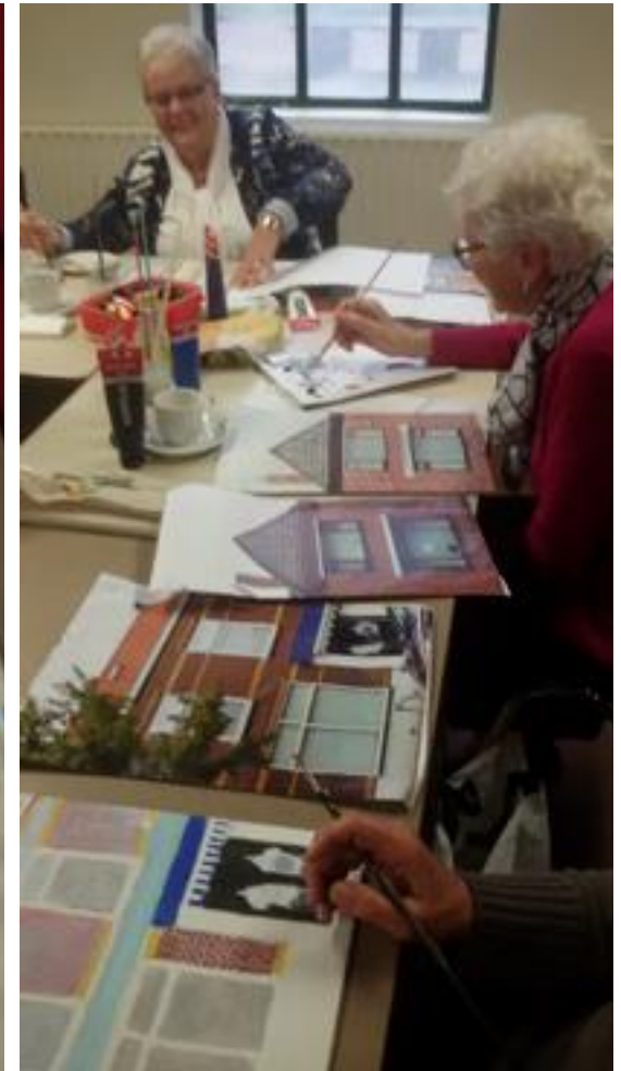
De stemming zit er goed in