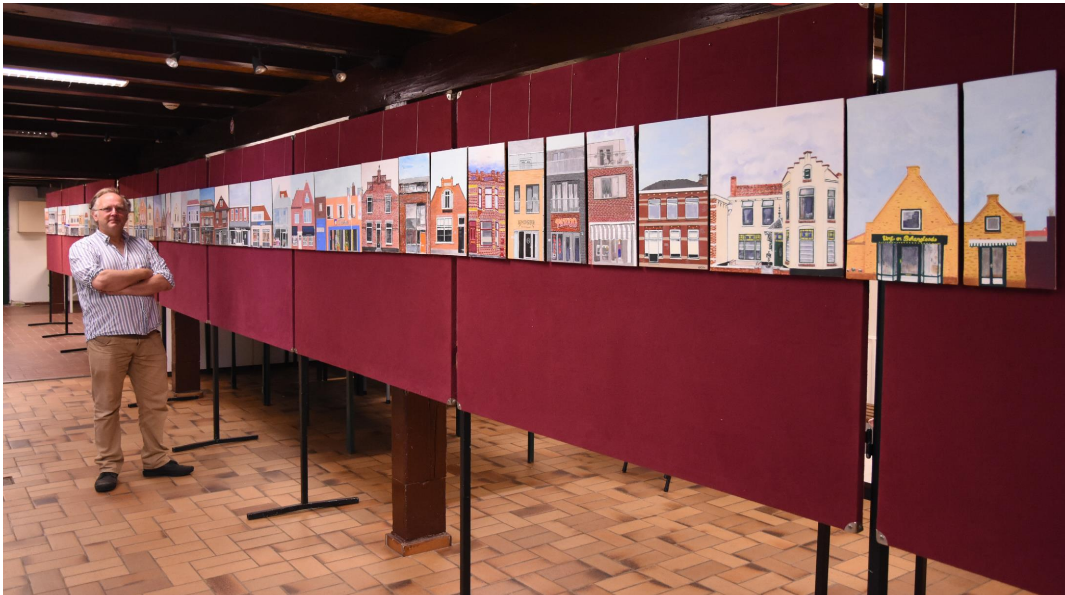
Het eindresultaat