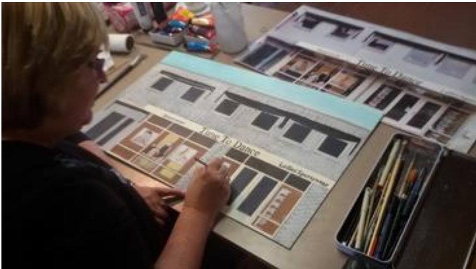
De etalages van Time To Dance lijken wel schilderijtjes