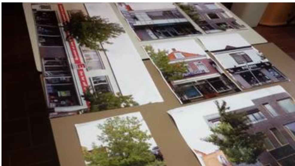
Het basismateriaal: foto's van de Herenstraat