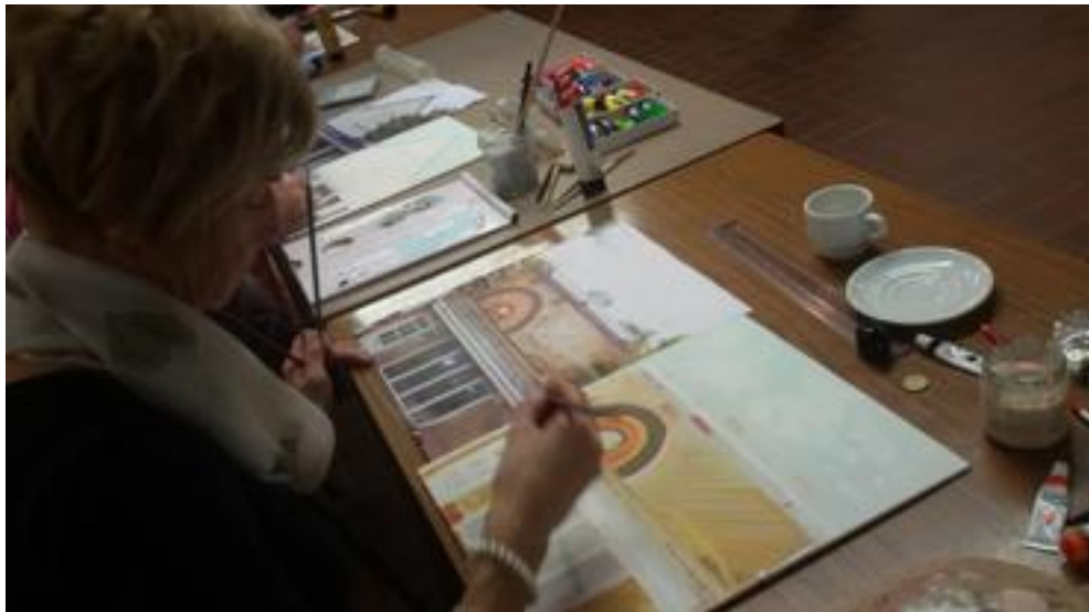
De Moldenbar nadert voltooiing