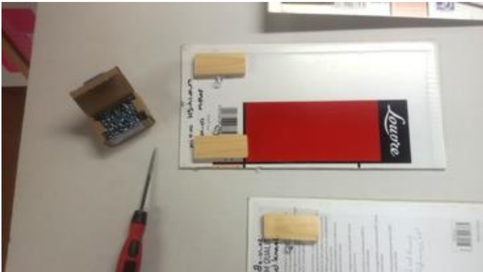
Blokjes lijmen en draad aanbrengen voor het ophangen