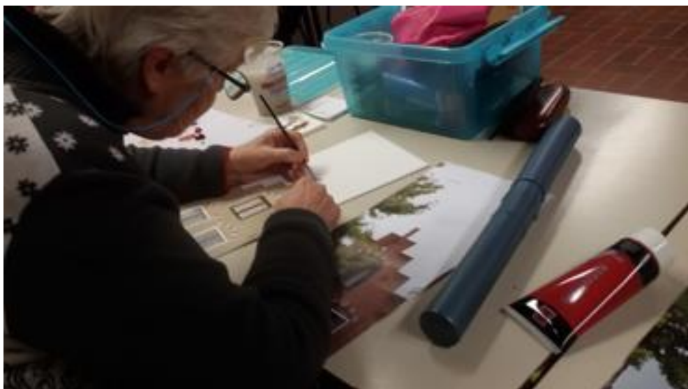
Zeer gedetailleerde werkwijze