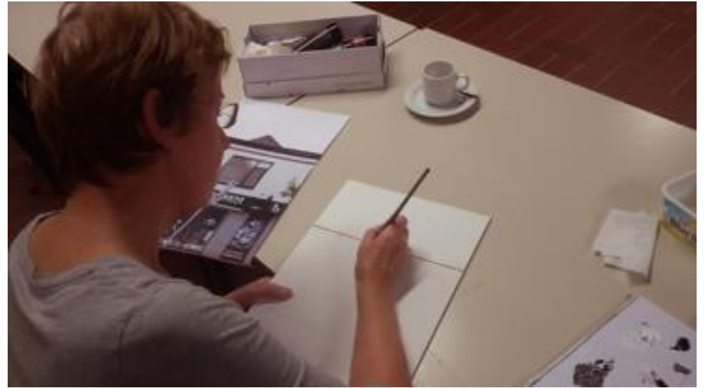
Werken met een dun penseel