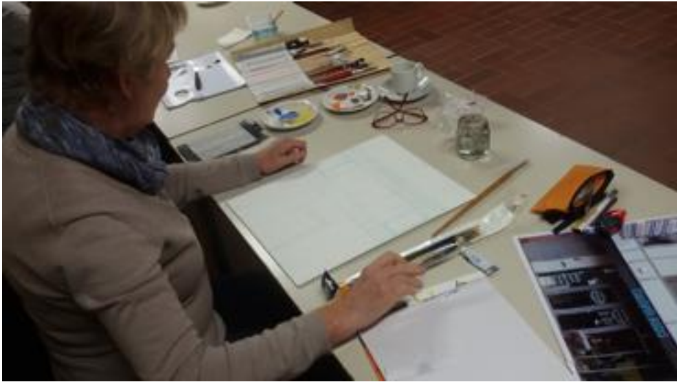
OK, de schets is klaar