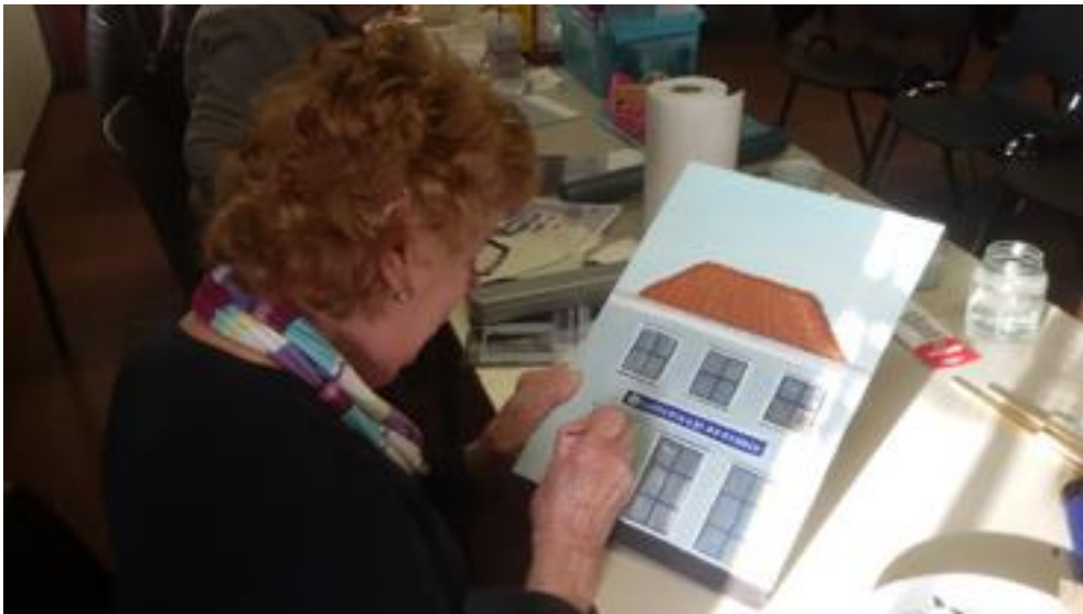
Latste hand leggen aan de apotheek